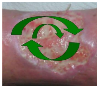
Grafik: Kerstin Protz, Hamburg

Bei Screening auf MRE erfolgt vor Abstrichentnahme keine Wundreinigung, um die tatsächliche Erregeranzahl möglichst exakt erfassen zu können. Die Abstrichentnahme erfolgt unter leichtem Druck von außen nach innen kreisend in Spiralförmigkeit bis zum Zentrum über die gesamte Wundfläche.